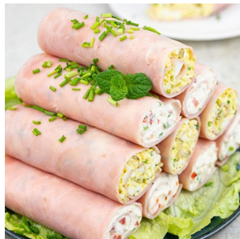
Roladki z szynki z serem, papryką, majonezem i pastą jajeczną