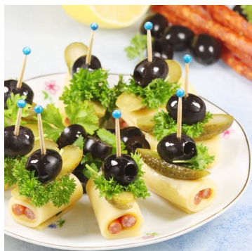
Koreczki z oliwkami, sałatą, ogórkiem kiszonym i kabanosami