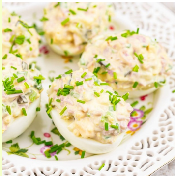
Jajka faszerowane szynką, ogórkami kiszonymi i majonezem