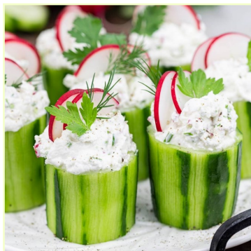
Ogórki z twarogiem i rzodkiewką