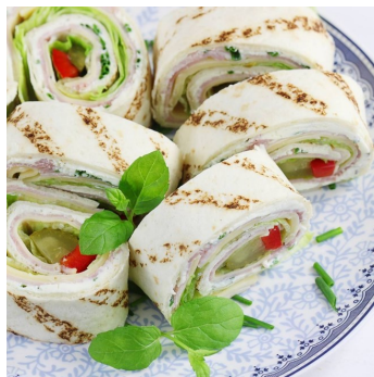
Roladki z tortilli z serem, szynką, ogórkami, pomidorami i sałatą